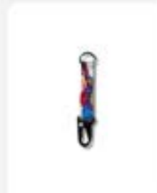
Keychain Binus ukuran 16 cm x 2 cm Rp32.500