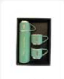
Tumbler Set Eksklusif ukuran 6,3 x 23,8cm warna Rp142.500