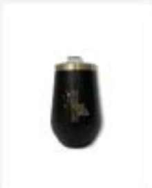
Tumbler Olive ukuran 12 cm x 7 cm warna Rp142.500