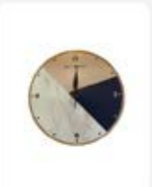
Wooden Clock Bina Nusantara ukuran 30 cm warna Rp99.500