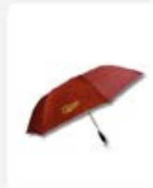
Binus Golf Umbrella ukuran big Rp155.500