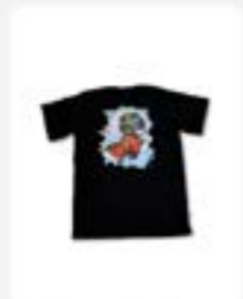
Tshirt Beehive X SOD ukuran M L XL Rp145.900