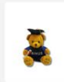
Boneka Wisuda ukuran 20 cm Rp90.000