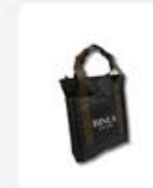
Totebag Edbert Evernext x Binus ukuran 40 x 6 x 38 cm Rp8500