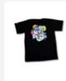
Tshirt Beehive X SOD ukuran M L XL warna Rp145.900