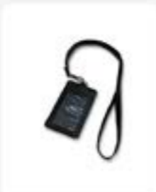
Lanyard Kulit ukuran 80 cm x 2 cm Rp75.000