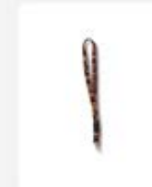
Lanyard Batik ukuran 80 cm x 2 cm warna Rp25.000