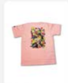
Tshirt Beehive X SOD ukuran M L XL warna Rp145.900