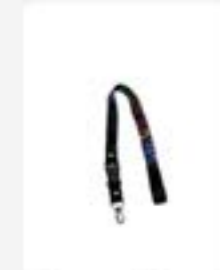
Lanyard Binus ukuran P 80cm x L 2cm Rp25.000