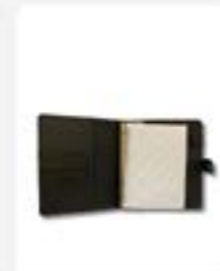
Binder ukuran A5 warna Rp105.000