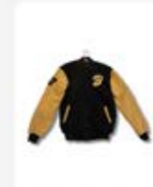
Jaket Varsity ukuran L XL Rp375.000