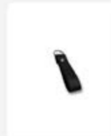
Keychain Kulit ukuran 16 cm x 2 cm Rp35.000